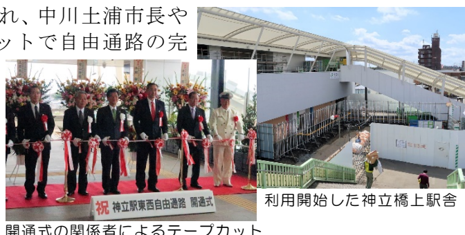
開通式の関係者によるテープカット

自由通路、駅舎とも、水戸方面側の階段整備などの工事が一部残っていますが、平成31年3月頃までに全体を完成する計画で今後も工事が進められます。