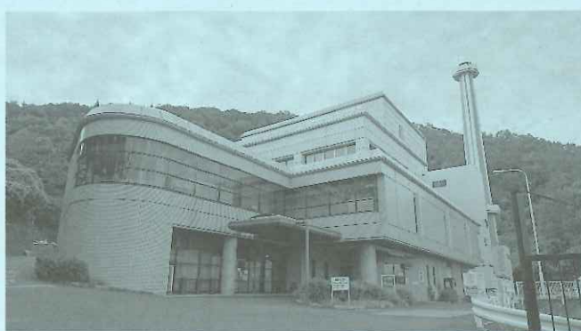
▲平成37年度末に停止する伊勢原清掃工場

今後も人と人が繋がるコミュニティの構築・拡大に努め、暮らしやすいまちとなるよう努力を続けたいと思います。