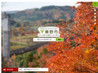
▲秦野市ホームページ

(1) 昨今は、「情報を制するものは、戦いを制す。」と言われる時代となる中、本市のホームページ(トップページ)は、全面が市内の風景画像(県立戸川公園)となっており、他市と比較して斬新ではあるものの、非常に使いにくいとの意見が市民より出されている。本市のホームページのコンセプトは何か？