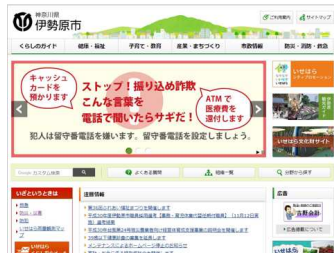
▲伊勢原市ホームページ