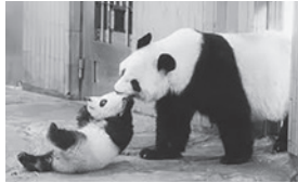
ジャイアントパンダ