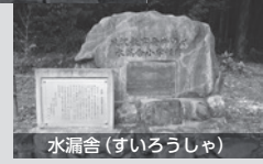
水漏舎(すいろうしゃ)

*「ひたちらしさ」とは…「自然環境の豊かさ、自然災害が少ないことや独自の文化・伝統、産業、施策等本市固有のもの、ほかにもあるが他に比べてより独自性や優位性をもつもの」と定義