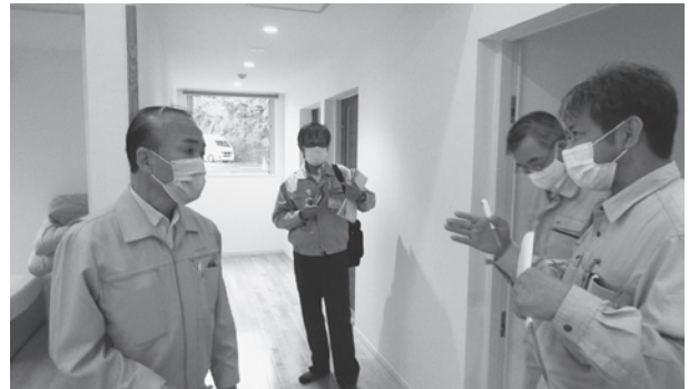
福祉施設の現地調査