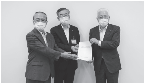
意見書を市長へ提出