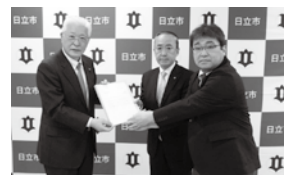
市政要望回答を受取る