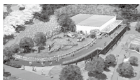
パンダ舎イメージ