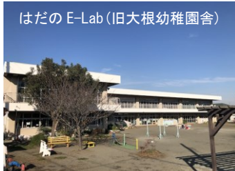
はだの E-Lab (旧大根幼稚園舎)