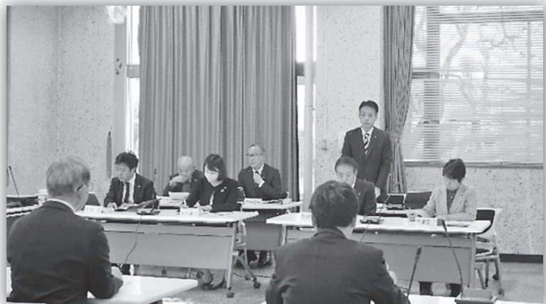
各種常任委員会（文教福祉委員会の様子）