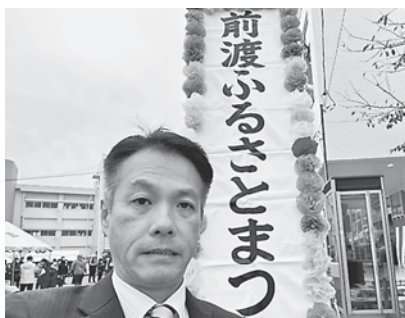
前渡コミュニティセンター前にて

11月12日(日)に前渡コミュニティセンター・勝田第三中学校内にて、「第45回前渡ふるさとまつり」が開催されました。当日は、飲食物やお花などを販売する模擬店、地域住民から出展された絵手紙や古典研究の発表など幅広い作品の展示、さらに勝田第三中学校吹奏楽部の演奏をはじめとする芸能発表が披露されました。