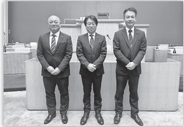
日新クラブ会派 集合写真