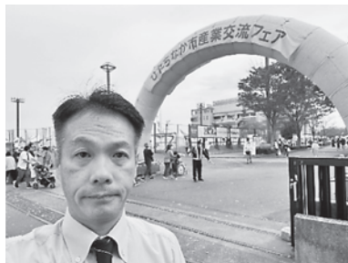
ひたちなか市産業交流フェア屋外会場にて

11月4日(土)～5日(日)の2日間、「ひたちなか市産業交流フェア2023」がひたちなか市総合運動公園内で開催されました。関東最大級の規模感を誇るイベントです。開催期間中は、ひたちなか市内の工業・農業・漁業・飲食店をはじめ約190団体が出店されました。また、来場者は2日間で約16万6千人とのことで、老若男女問わず、多くの方々が来場され大盛況でした。