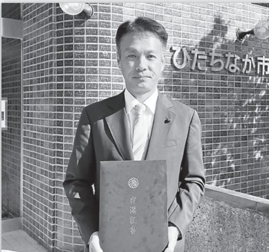
3期目の当選証書を授与

常日頃より、議員活動に対します皆様方のご支援、ご指導に深く感謝申し上げます。昨年の10月22日(日)に行なわれました「ひたちなか市議会議員一般選挙」では、多くの皆様にご支援とご協力を頂き、当選の栄を勝ち取ることが出来ました。改選後、11月には第4回臨時会、12月には今年度の第5回定例会が開催され、議員として3期目の活動がスタートしました。