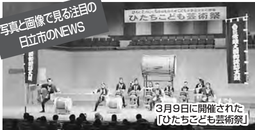
3月9日に開催された 「ひたちこども芸術祭」