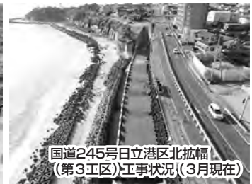
国道245号日立港区北拡幅 (第3工区)工事状況(3月現在)