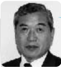
松本 敏 横浜市議会議員 (ソフト支部)