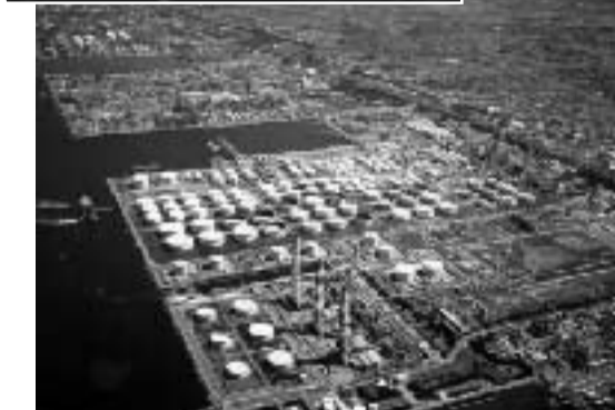
地域性を活かした養老川河口にある海釣り施設(上) 市原市の中核をなす京葉臨海工業地帯(下)

協働、分かりやすい計画づくり、とし、元氣ないちばら、ふるさと市原の再生に向けて、より透明性を高める効果が実感できるよう、市民会画策定にあたり、政策委員会を設け市民と協働して市の将来像をそれぞれ責任と役割りを分担して、アウトカムを重視した計画作りを推進していきます。 議、タウンミーティング等を精力的に進めています。市の将来像を決める大事な総合計画策定にあたり、政策委員会を設け市民と協働して市の将来像をそれぞれ責任と役割りを分担して、アウトカムを重視した計画作りを推進していきます。