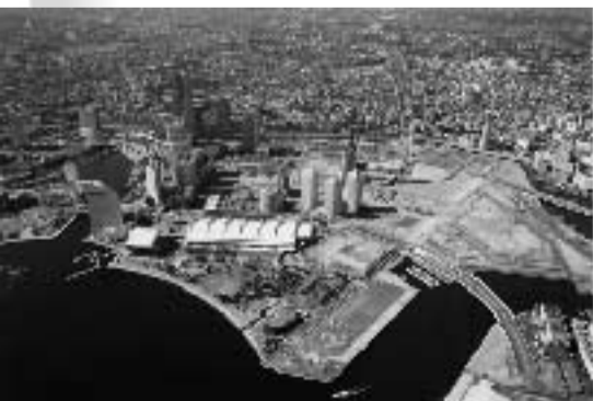
横浜の底力を見せる「みなとみらい」

首都東京の近くにある横浜市の悩みは「支店経済」です。本社機能を有する企業誘致が困難な状況下でみなとみらい地区を造成し、新しい横浜を目指してきました。就業人口19万人、居住人口1万人を目標に企業誘致を進めてきましたが思い通りの進捗とはいきませんでした。そこで作ったのが「横浜市企業立地等促進特設地域における支援措置に関する条例」です。その内容は固定資産税・都市計画税を5年間半分、投下資本額の10%(上限50億円)の助成金交付で