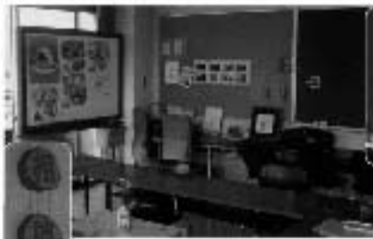
教育支援センター