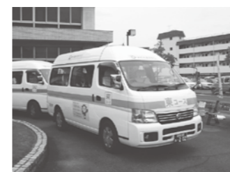
尾張旭市営バス(公共交通)9人乗りのワゴン車で車体分けされています

市では、交通空白地域の改善や市民交流を推進するために尾張旭市営バスの設置を行ない、平成16年12月か