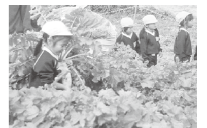
農業体験イメージ(大根掘り)

4. 町村の交流拠点、交流イベント開催により市民の憩いの場を提供 ◇事業規模 16,000平方メートル、詳細は未定