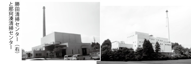
勝田清掃センター(左)と那珂湊清掃センター(右)

区の国有留保地(安全運転中央研修所南側付近)とし、日量約220トン規模で、余熱を利用した約3000キロワットの発電施設も建設する予定です。さらには、焼却灰の溶融可能な施設を設け焼却灰をスラグ化し、溶融スラグの再資源化を図ります。そのことにより埋め立てする灰が減量されるので、最終処分場の延命化も図っていく方針です。これまでに至った背景は、日新クラブ議員団の代表質問や一般質問などでの提言を取り入れられたものと思っています。今後も将来を見据えた環境改善・整備などに努めていく所存です。