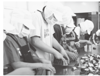
缶詰作業にチャレンジ(水産業探検少年団)

いくための「ものづくり学校」創設を目指し鋭意活動を進めています。09年度の茨城県技能五輪全国大会では、「ものづくり学校」を日立魂の発信基地にしていきたいと考えています。