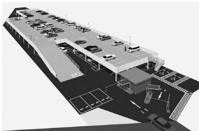
勝田駅東口駐車場パース

改善されたところはありますが、残された課題について、これからも一つひとつ解決を図り、市民サービスの向上に努めていきます。