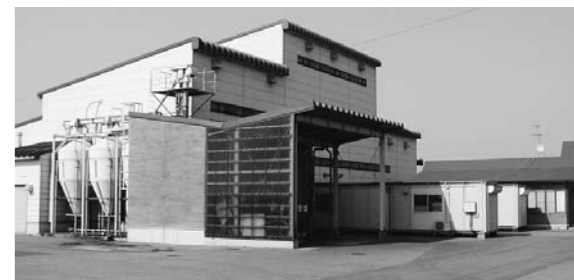
活況を呈している製粉工場

も競技の開催地になることから「米粉のまち胎内市」をめざし、県内外に積極的にPRしていきたいと思っています。