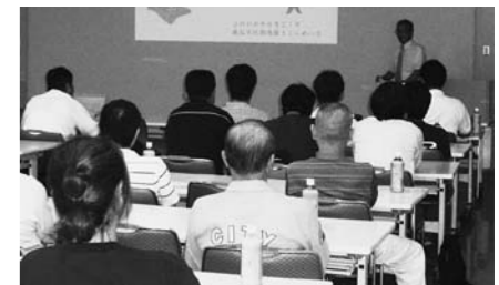
市政報告会で市民の意見を聞く

た街創りに、議員として多くの市民の皆様の声聞きながら活動をしていきたいと考えております。