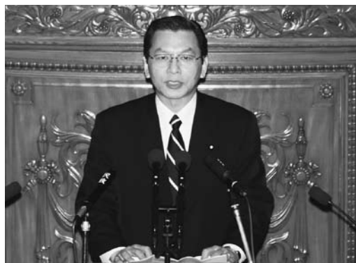
本会議で政府の金融政策を質す

介護職員の給与水準が低いために、若い介護士の方々が、将来設計が出来ないとして仕事継続を断念している現状にあります。今回、3年間のみ月1.5万円を上乗せするという方針ですが、その