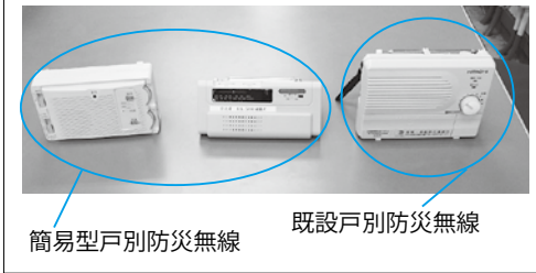
簡易型戸別防災無線