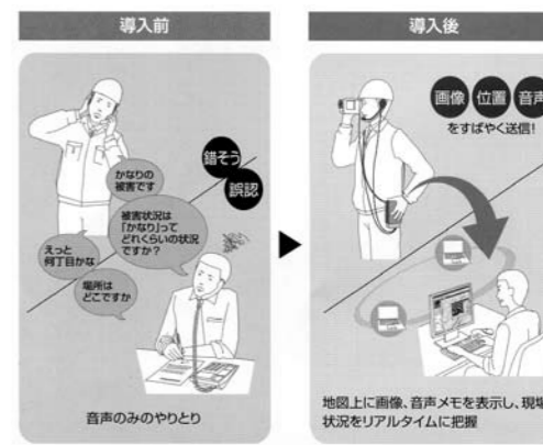
災害情報支援システムを解説するパンフレットより

沼津市は約62kmの海岸線、山あり、川ありの風光明媚な安全都市ですが、今後も、地震、洪水などの災害に強いまちづくりをさらに進めると共に、情報技術を活用した災害対策の施策充実に努力します。