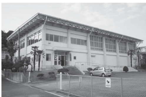
中長期的な視点から 公共施設の今後の在り方を検討