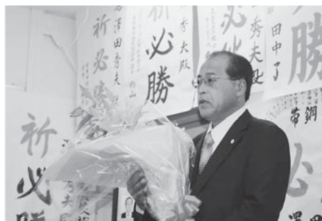
皆様のご支援により 初当選を飾る