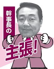
日立グループ議員団幹事長 栃木市議会 (日立AP労組栃木支部)

今年の安来市政は、一市二町の平成の大合併から10年の節目の年にあたります。また市庁舎を始め市民会館や消防署、給食センター等の大型事業も次々と予定されており、今後新たな街として変貌する布石になると考えています。しかし一方では、厳しい財政運営が見込まれ、現状の市民サービスの質と量の低下が懸念されます。財政をしっかりとチェックし、市民の代弁者として選択と集中で今以上に活力ある街になるよう、努力して参りたいと考えています。