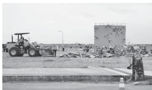
防災訓練にてがれき処理を実施