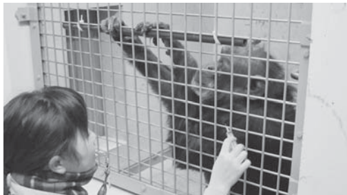
チンパンジーに採血のトレーニング