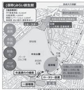
(仮称)みらい創生館の施設概要

老朽化の課題を克服しながらも、子どもから高齢者まで幅広く集い、愛される施設をつくることによりコミュニティが活性化され、さらには賑わいと呼び、地域経済振興の柱となるよう期待を寄せており、実現に向け私はしっかりと手綱を握っていきたいと考えています。