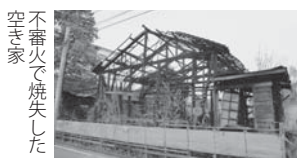
不審火で 焼失した 空き家

ひたちなか市では、平成28年4月から「空家等対策の推進に関する条例」を施行するとともに、空家対策推進室を設置しました。この条例では、空き家等に関し必要な事項を定め、安全で安心なまちづくりの推進及び地域の活性化を目的としています。