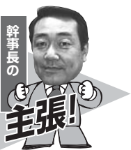
日立グループ議員団幹事長 栃木市議会 (日立AP労組栃木支部)