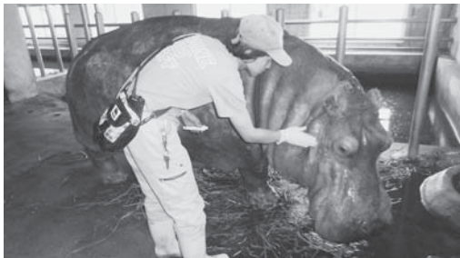
高齢カバ(バジャン)のケア