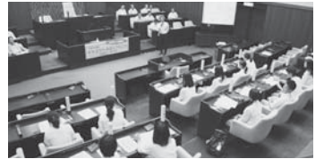
高校生との懇談会風景