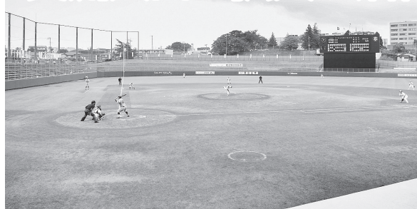
プロ仕様の公認規格へと拡張された野球場