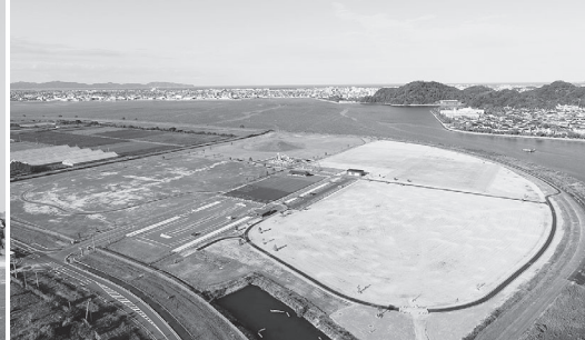
中海に面するグラウンド

平成27年から約9億円をかけて整備を続けてきた、新公園が全面供用することになりました。新公園は西エリアと東エリアで構成され、総面積は、31haになります。