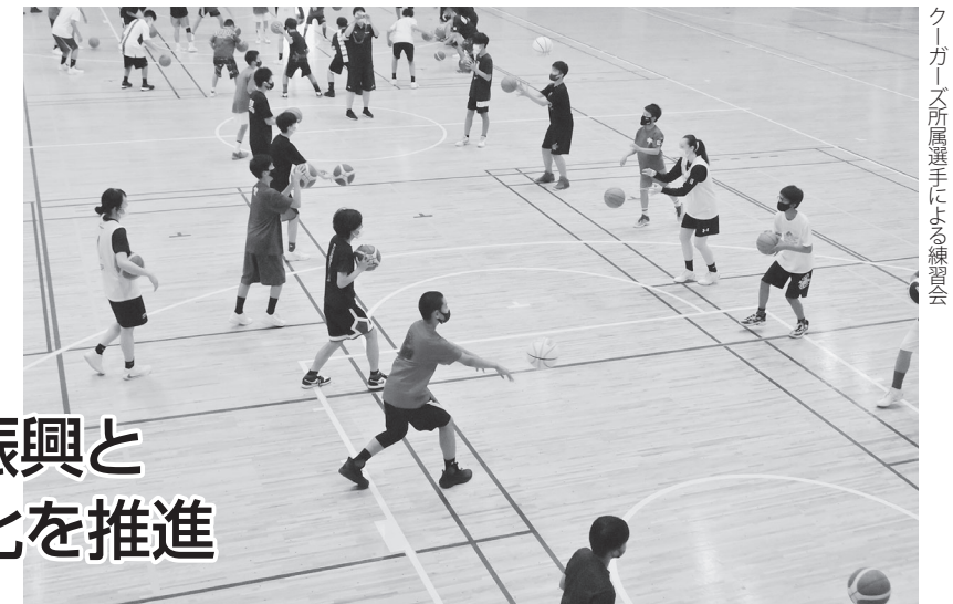
クーガーズ所属選手による練習会