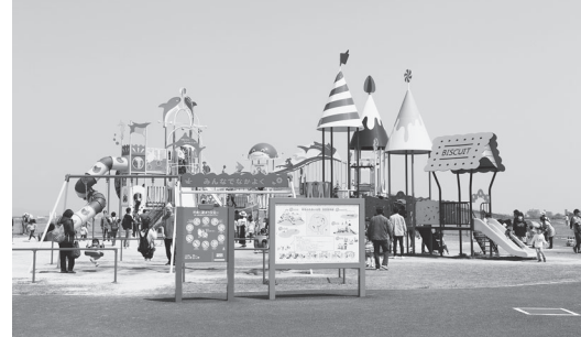
年齢にあわせて遊べる遊具