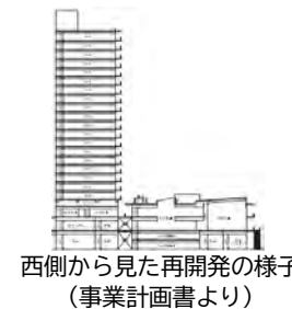
西側から見た再開発の様子（事業計画書より）

回答：収益確保につながる方法に関する勉強会を行うなど、将来の運営を見据えて活動している