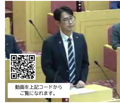
動画を上記コードからご覧いただけます。