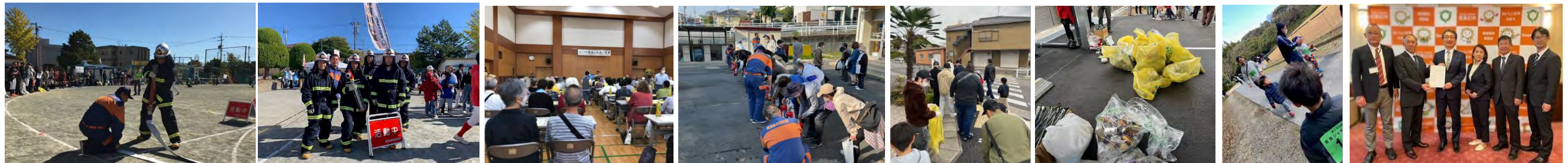
様々な行事にお招きいただき、市民の皆様とお話をさせて頂きました！いつもお声掛けありがとうございます♪