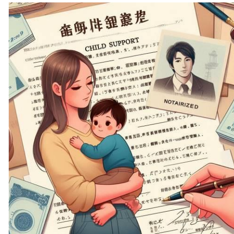
子供の成長を支えるために 養育費不払い防止に取り組む必要がある

Q 市原 養育費不払防止のために、公正証書作成に係る費用の補助制度を求める。 A 市原 公正証書作成補助制度について実施内容や効果を調査し、検討する。 Q 市原 養育費不払トラブルに関し、市への相談事例等を伺う。 A 市原 養育費に関する相談は少ない。しかし、児童扶養手当の現況届の養育費の支払い状況から、継続して養育費の支払いを受けている方は多くない。全国調査の数値(28.1%)と同レベルと思う。 Q 市原 県内の他自治体で導入されている公正証書作成補助制度について実施内容や効果を調査し、検討する。 A 市原 県内の他自治体で導入されている公正証書作成補助制度について実施内容や効果を調査し、検討する。