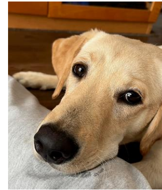
我が家にいる通算5頭目の介助犬パピー