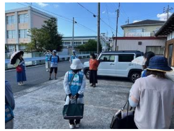
下校パトロールに参加