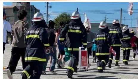
頼もしい消防団の後ろ姿（地元運動会にて）