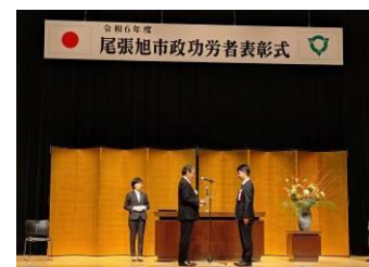
永年にわたる消防団活動に対し代表して表彰いただいた