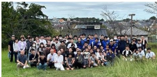
市民祭前に各企業の組合員と城山公園を清掃