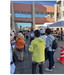
地元の防災訓練や小学校の運動会の様子