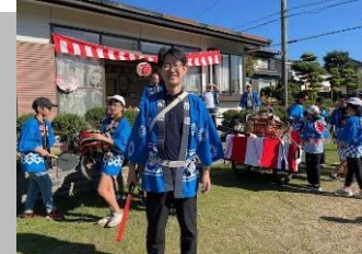
地域や市の行事に呼んでいただき、市民の方々と会話する機会を頂く