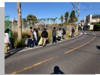
旭精機、旭サナック労組による地域清掃活動に参加