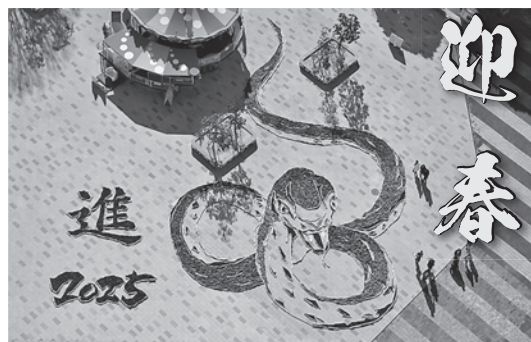
ひたち海浜公園：干支の巨大地上絵