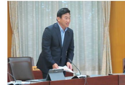
熊本県とのDX推進に関する意見交換