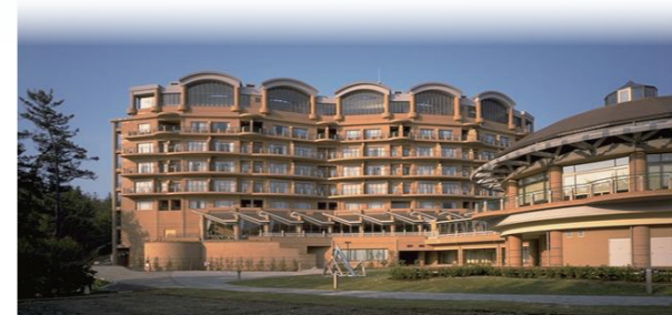
茨城県立国民宿舎「鶴の岬」

X(旧Twitter)で発信しています! 日々の政治活動や、皆様のお役に立つ行政情報などを発信しています。ぜひ、フォローをお願いします!