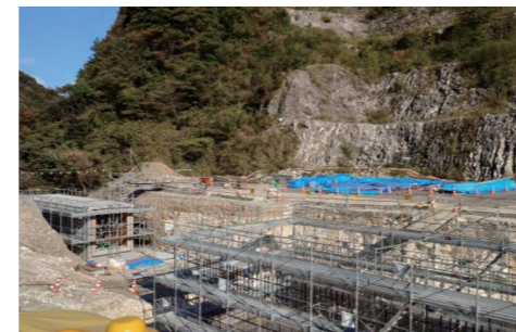
▲防災調整池工事 (R6.11.14撮影)