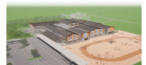
(仮称)神栖特別支援学校整備イメージ