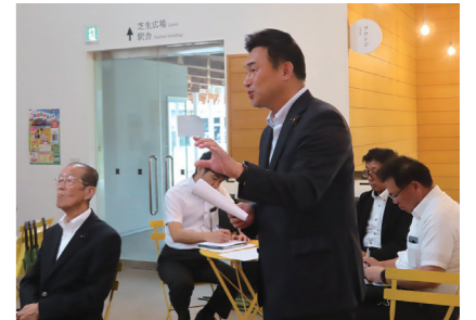
県外調査での意見交換