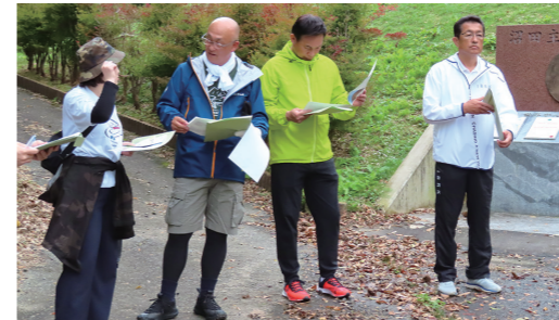
県北ロングトレイル調査(北茨城市)