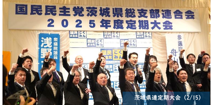
茨城県連定期大会 (2/15)

2月11日には、東京都内で国民民主党の5回目となる党大会が開催されました。2025年も「手取りを増やす」ことが最重要の政治課題の一つであり、引き続き「103万円の壁」の引上げ、ガソリン代値下げや電気代値下げなど「手取りを増やす」政策の実現に全力で取り組むことが確認されました。今後も「対決より解決」の姿勢で、政策本位で活動していくことを全会一致で採択しました。また、15日には茨城県連の定期大会も開催し、今年度の活動方針を確認しました。