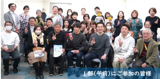
1部(午前)にご参加の皆様