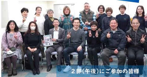
2部(午後)にご参加の皆様

2月16日、日頃からお世話になっている桜きらめき会議の皆さまの企画で、トーク&交流会のイベントが日立シビックセンターで開催され、初参加の方も含め、多くの地域から参加いただきました。日立市の現状や実態、教育、労働、働き方や県北の未来、そして、党の政策の「103万円の壁の引上げ」や「ガソリン暫定税率廃止」を説明しながら、地域からの声に耳を傾け対話を行い、2部制でも時間が足りなくなるくらい、未来に向けた多くのお話をさせていただきました。